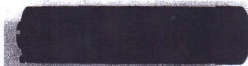
Фото 1. Представленное на исследование устройство пламегаситель "НОЧЬ 29,6*53R LANCASTER" (код 20080).

Представленное устройство показано на фото 1, 2.