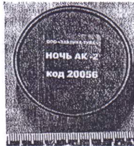
Фото 3. Маркировочные обозначения на упаковке.

Представленное на исследование устройство, имеет длину 182 мм, наружный диаметр в средней части 45 мм (см. фото 1). При разборке разбирается на три части, (см. фото 2).